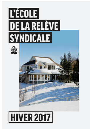
Brochure : École de la relève syndicale, hiver 2017