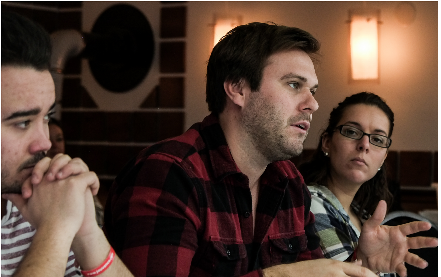
École de la relève syndicale, été 2016.

En plus de ses activités habituelles, qui sont bien enracinées, le comité s'était donné pour objectif de renforcer ses interventions politiques, entre autres, en participant à la consultation sur la Politique québécoise de la jeunesse 2030 et en intervenant sur son plan de mise en œuvre. Le comité voulait aussi accroître la place des jeunes au sein du mouvement CSN et prendre une part plus active au travail intersyndical.