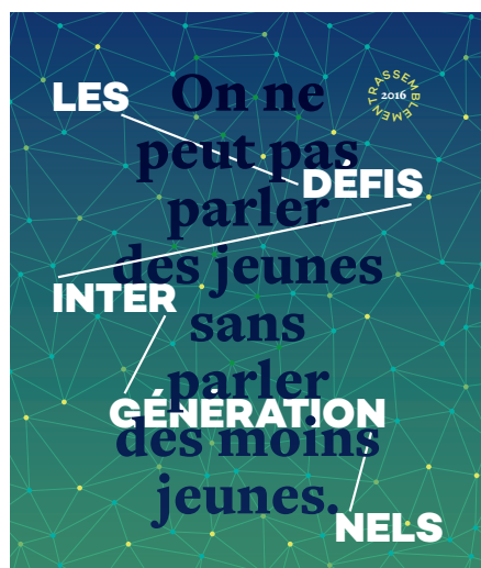
Affiche : Rassemblement des jeunes de la CSN

À l'occasion de ce rassemblement, et à de nombreuses reprises, l'importance de l'accueil des nouveaux membres a été soulignée. Le comité entend bien en faire un élément de son plan de travail pour le prochain mandat. Dans la foulée du rassemblement, un article sur l'équité intergénérationnelle est paru dans l'édition de janvier 2017 du magazine Perspectives .