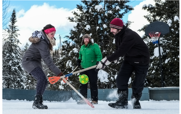
École de la relève syndicale, hiver 2017.