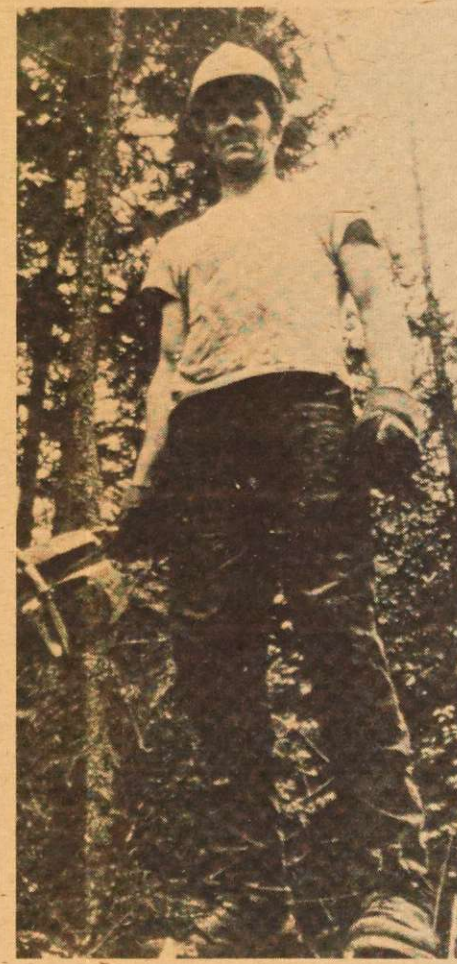
Tableau comparatif des salaires payés en forêt

5. Une structure démocratique, où les officiers des syndicats locaux se réunissent au moins 2 fois par année lors du bureau fédéral, pour vérifier la vie syndicale de la fédération et travailler à l'orientation des politiques.