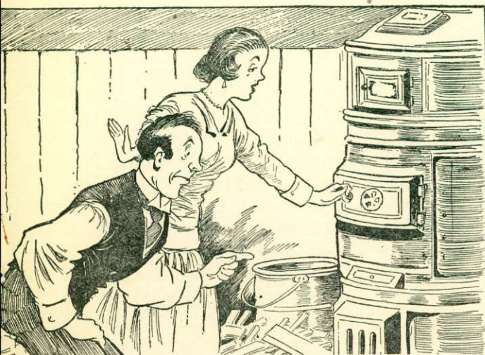
La femme s'amène à la cave et, en murmurant quelque chose au sujet de la gaucherie des hommes, elle te dit qu'elle va te montrer comment l'y prendre —